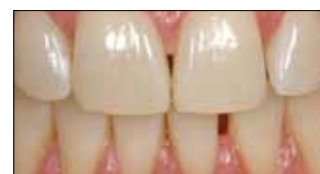
После применения шести кап с Opalescence Trèswhite Supreme.