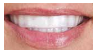
6. Носите капсу 10% 30–60 минут.