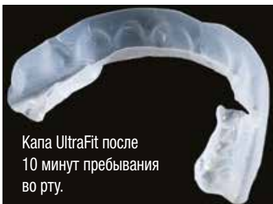
Капа UltraFit после 10 минут пребывания во рту.