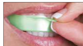
2. Выверните капсу по центру зубного ряда.