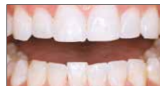
После применения десяти кап с Opalescence Trèswhite Supreme.