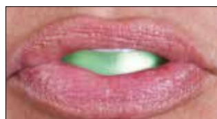
3. Медленно втяните воздух или сглотните.