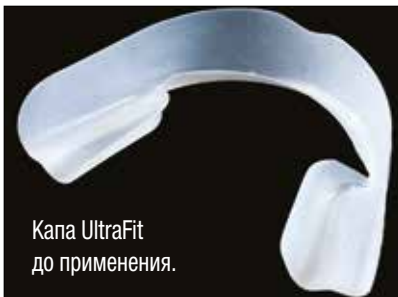
Капа UltraFit до применения.

Превосходная адаптация капы UltraFit™ к анатомии зубов.