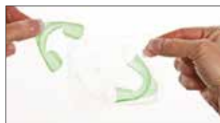
1. Выньте из упаковки.