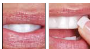
5. Снова втяните воздух или сглотните.