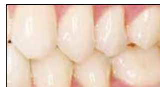
После применения десяти кап с Opalescence Trèswhite Supreme.