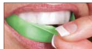
4. Снимите внешнюю капсу.