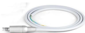
Рис.2 Микро мотор и кабель