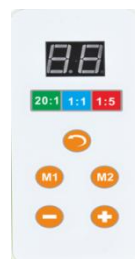
Рис.3 Панель управления