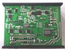
Рис.1 Плата управления