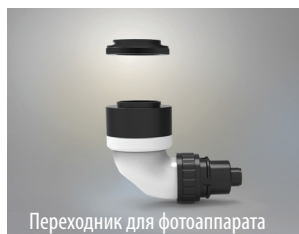
Переходник для фотоаппарата